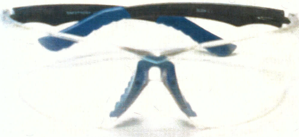
SAFETYLINE typ SL004